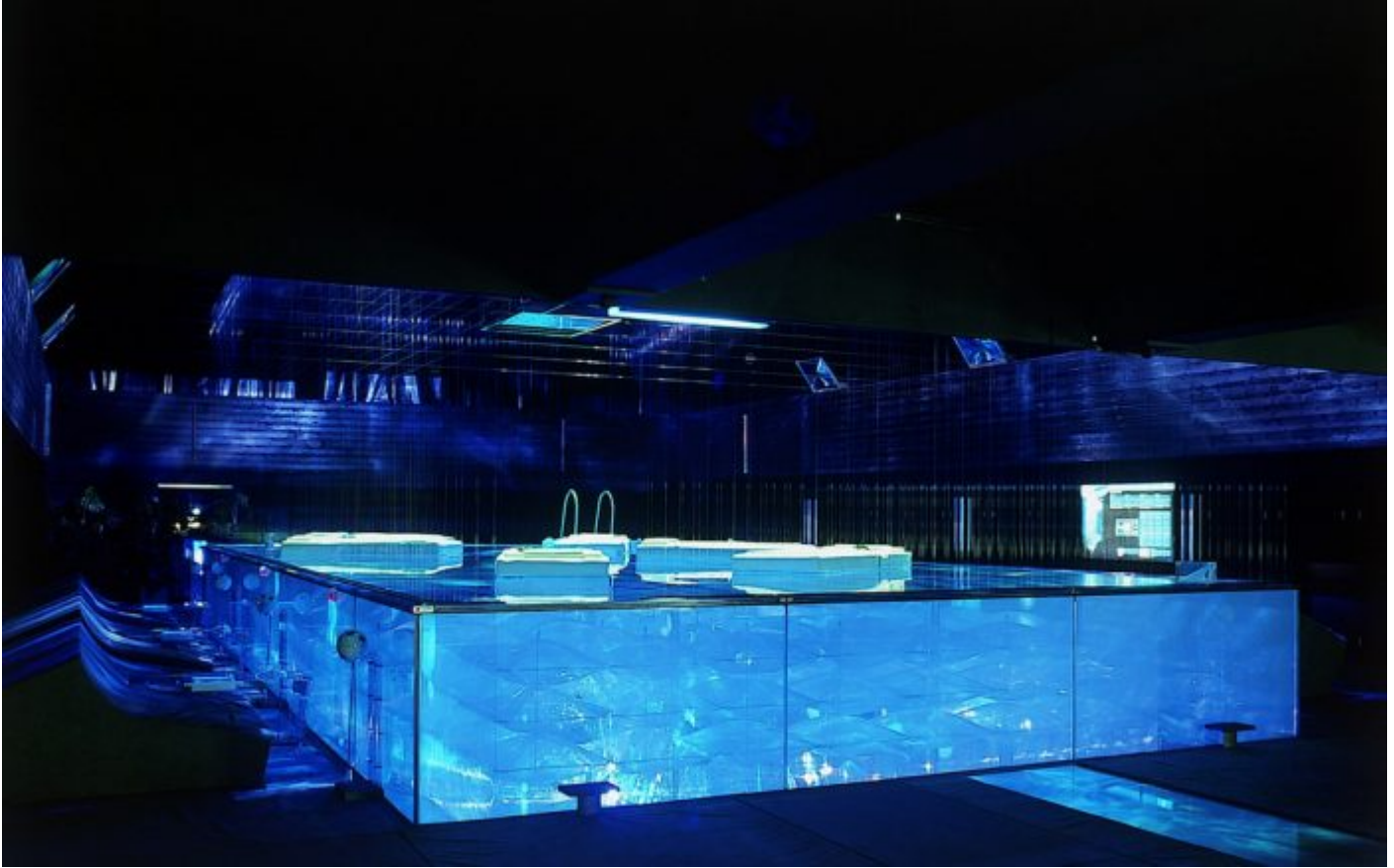
10. Centro comercial.