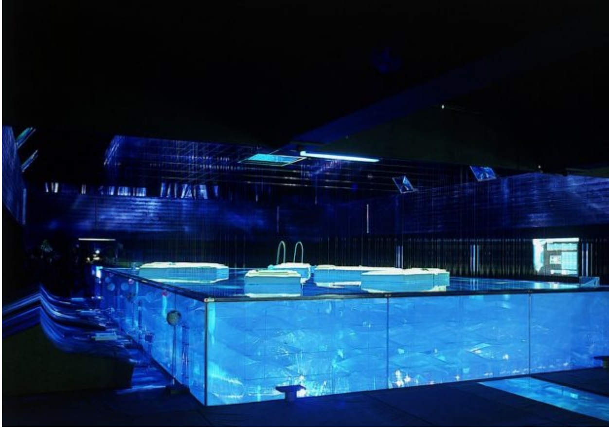
10. Centro comercial.

Firmado electrónicamente | DIARI OFICIAL | ID: 8637859dd7